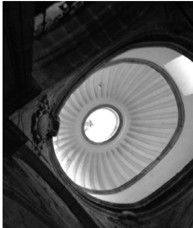
Lám. 19. Cúpula de la capilla funeraria de linaje de los Carvajal. San Nicolás de Plasencia.

duce cuando se elimina totalmente un muro lateral, de manera que el volumen generado con la ampliación resulta muy importante tal y como vemos en la capilla de los Vargas en la iglesia de Santa María de la misma ciudad y que aquí mostramos. En esta última capilla, el espacio funerario aparece realzado al quedar elevado sobre el plan de la iglesia y tener que acceder a él a través de una escalinata flanqueada por dos pretilos con sus antepechos profusamente adornados con grutescos, putti y otros elementos.