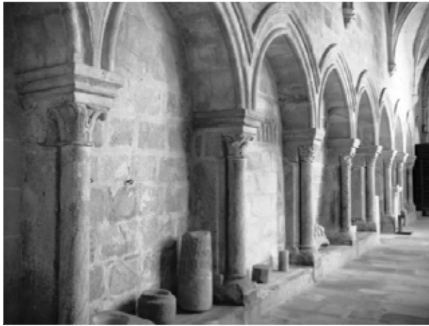
Lám. 14. Línea de arcosolios. Claustro de la Catedral de Plasencia.

evangelistas y escudos blasonados mientras en los dos frentes están San Jerónimo y San Gregorio. Las esquinas aparecen rematadas por figuras con cuerpo de águila y cabeza sustituida por volutas. Sobre la tapa, el cuerpo yacente de Bravo de Jerez, en armas, con los guanteletes descansando a un costado y el casco junto al pie derecho. En el lado contrario, restos de lo que debió ser un paje velador adormecido que parece apoyar su cabeza sobre la mano izquierda; eso es lo que suponemos dado el deterioro con el que ha llegado.