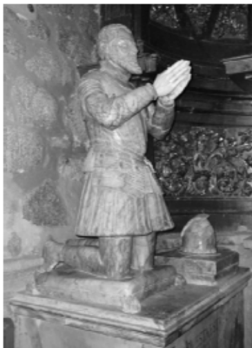
Lám. 24. Figura orante del Coronel Villalba. Convento de las Ildefonsas de Plasencia.

termina 33 . En el siglo XVII el sepulcro fue desguazado y, en sustitución del mismo, alguien encargó las dos figuritas que ahora se conservan donde arriba se comenta, con un resultado lamentable.