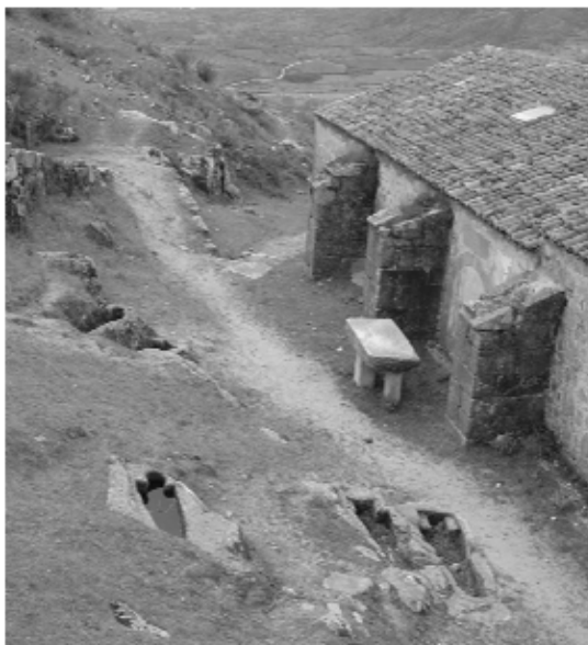
Lám. 1. Sepulcros alrededor de la iglesia. Castillo de Trevejo.

rencia. La guerra civil del siglo XIV y el resultado final de la misma con el triunfo de la facción Trastámara, reforzará la posición social de sus partidarios y atraerá la presencia de otros linajes ya consolidados procedentes del norte del país.