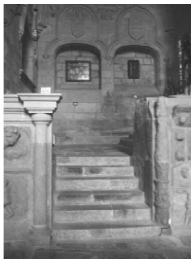
Láms. 17 y 18. (Izda.) Losas practicables de acceso a la cripta. Santiago de Trujillo.

(Dcha.) Capilla funeraria de linaje de los Vargas. Santa María de Trujillo.