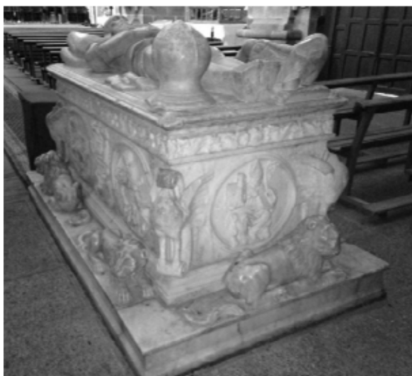
Lám. 13. Sarcófago monumental del Comendador de Piedrabuena. Santa María de Almocóvar de Alcántara.

Volviendo al otro lado de la región que nos ocupa, en la capilla del Comendador de Piedrabuena de la imponente iglesia conventual alcantarina, estuvo durante un tiempo el sarcófago del que la mandó construir, frey Bravo de Jerez. Cuando el sepulcro corrió el riesgo de ser perdido para la villa, el párroco tuvo el acierto de hacerlo desmontar y trasladar a la parroquial de Santa María y colocarlo donde ahora se pueda admirar. Solo cometió un error y es que lo dispuso al revés de como tenía que haberlo hecho. Este monumento funerario exento, que es una pieza importante dentro de los de su género, muestra sobre un basamento que sobresale del cuerpo principal, seis leones tendidos que juegan el papel alegórico al carácter del comendador. Los costados del arca están profusamente decorados con motivos sobre los cuatro