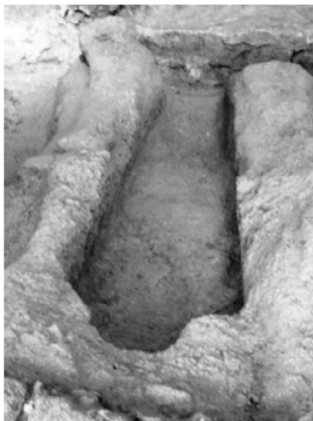
Lám. 6. Fuesa antropomorfa recrecida. La Magdalena de Plasencia.

El tener como filtro, para acceder al enterramiento en el interior del templo, la necesidad de estar considerado como persona cierta y ser , éste, un concepto que puede interpretarse de forma diferente dependiendo de la perspectiva con que se enfoque, la consecuencia será que los espacios disponibles pasarán a ser objeto de cierta concurrencia competitiva y, en consecuencia, dentro de los mismos se producirá cierta nivelación igualatoria. A pesar de ello, hay valores que siguen siendo de referencia dentro del conjunto social.