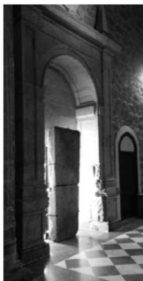
Láms. 20 y 21. (Izda.) Capilla funeraria de linaje de los Sande. Valdefuentes. (Dcha.) Capilla funeraria de linaje de los Carvajal-Camargo. Plasencia.