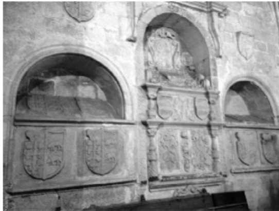
Lám. 16. Arcosolios monumentales de los Ovando-Mogollón. San Mateo de Cáceres.

misma ciudad. El monumento, renacentista, tiene labrado en su frente tres medallones que acogen los retratos de los tres hermanos. Debió ser encargado por el que aparece descubierto y en edad madura, bien definido y fielmente reproducido, esculpido con detalle. Los otros dos medallones acogen los bustos de los dos hermanos militares fallecidos en su juventud y de los cuales no se mantiene un recuerdo claro de sus respectivas fisonomías por lo que estas aparecen un tanto estereotipadas y desvaídas.