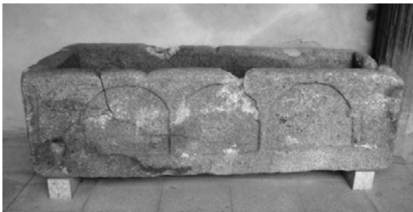
Lám. 7. Arca sepulcral. Parador de Turismo de Plasencia.

transversal, situados: el primero centrado y el segundo más o menos a un tercio de la cabecera, configurando una nervadura en forma de cruz, o bien, una representación explícita de la misma. La siguiente complicación sería tallar la tapa con cuatro faces: dos triangulares en la cabecera y los pies normalmente de mayor tamaño la primera y dos trapezoidales iguales una para cada costado.