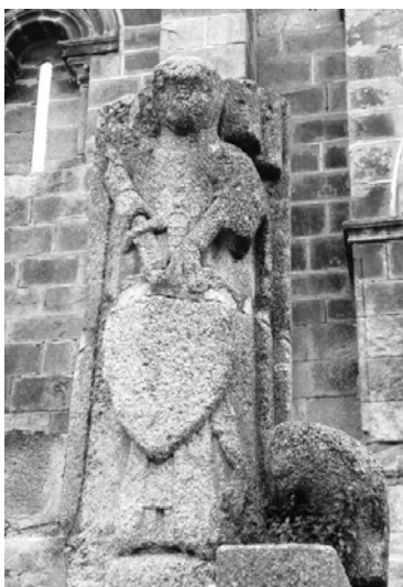
Lám. 9. Tapa de sarcófago con caballero freyre yacente. Santa María de Almocóvar de Alcántara.