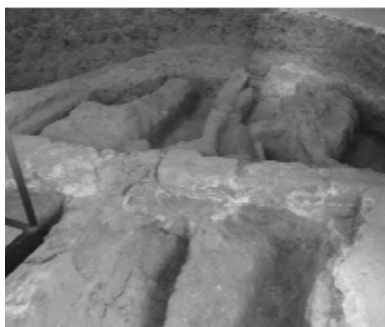
Láms. 2 y 3. (Izda.) Espacio funerario extra ecclesia . El Salvador de Plasencia. (Dcha.) Fuesas intraecclesia . La Magdalena de Plasencia.

Obligado el enterramiento a ras, la fuesa se viste con lanchas de piedra en el fondo y en los laterales, de manera que pueda soportar con firmeza la tapa que quedará a nivel con el suelo del atrio. Más adelante, en función de la categoría del difunto, se incorporarán fuzillos ya elaborados que se enterrarán con tapa o se labrarán sobre la misma piedra allí donde el terreno aconseje hacerlo así.