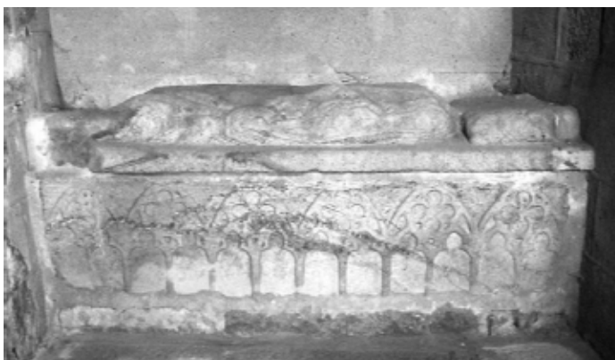
Lám. 8. Arca sepulcral con bulto yacente de caballero. Claustro de la Catedral de Plasencia.

visión eterna de Dios 13 . Finalmente, cuando el tipo de enterramiento alcanza el punto culminante de su expresividad, el muerto vendrá reproducido fielmente, tal y como fue en el momento de su fallecimiento pues, inmediatamente al suceso, se le habrá hecho una mascarilla para el caso.