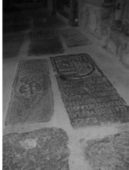
Láms. 4 y 5. (Izda.) Laudes sepulcrales. Claustro del Monasterio de Guadalupe. (Dcha.) Laudes sepulcrales. Transepto de Santa María de Trujillo.

En el interior del templo, a la hora de jerarquizar su calidad como enterramiento, se establece una parcelación del espacio disponible que lo ordena preferencialmente. El lado del Evangelio es de mayor valor que el de Epístola y, en uno y otro, es más valioso cuanto más próximo a la cabecera del templo se encuentra. Esto tendrá validez hasta la mi-