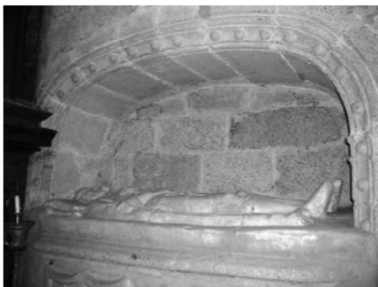
Lám. 11. Sepultura de caballero freyre de Alcántara. San Mateo de Cáceres.

bería ajustarse a este principio. Sirva como información complementaria que en el Capítulo General de la Orden celebrado en Burgos en 1495, es nombrado Comendador de Lares un tal frey Nicolás de Ovando 18 y que, en la Carta-Licencia imperial que autoriza la construcción de la capilla del Comendador Bravo de Jerez en el Convento de Alcántara, se explica que, ésta, se ubica “cabo la capilla del Comendador Mayor Ovando” en el lado de la Epístola de la iglesia 19 , de donde falta su respectivo enterramiento.