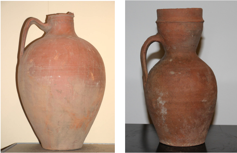
Figs. 12 y 13. Cántaro (siglo XVI) y jarro (siglo XVI).

JARRAS. Recipiente ventrudo y redondo de cuello y boca ancha, fondo plano y doble asa de hombro o panza a cuello 94 . En Sevilla, como en nuestro caso, su acabado es en basto por lo que deducimos que se usaron preferentemente para agua 95 . En Jerez de la Frontera se aplica la denominación de jarra a piezas pequeñas, de forma similar a la descrita, con una o dos asas que se utilizan para beber como taza o vaso y llaman alcarrazas o tallas 96 .