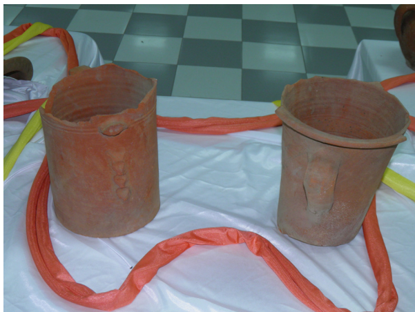
Fig. 19. Bacín (siglo XVI).