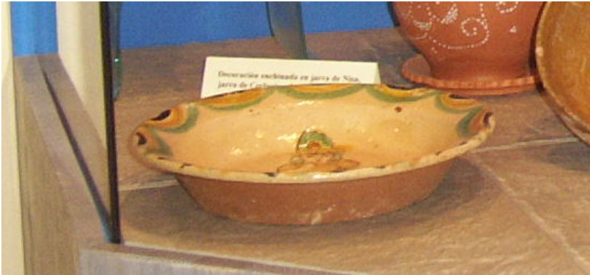
Fig. 17. Plato (siglo XVI).

mentados 122 . En Fregenal se ha hallado, como en Salvatierra, un único plato -más bien escudilla- de tradición mudéjar con decoración 123 .