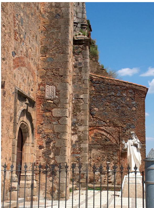
Fig. 6. Iglesia de San Blas. Vista lateral. Exterior.

excelente fábrica pero haciendo gala de una gran sobriedad. En el caso de la Parroquia de San Blas (Fig. 5) la cabecera, que se adosa a la fábrica inicial mudéjar de ladrillos, se convierte, tras la ampliación, en el primer tramo de la nave de tres crujiás de la iglesia que se embellece en el lado del Evangelio con una puerta purista en la segunda mitad del siglo XVI, se adornan los remates de los contrafuertes exteriores con pilaritos, columnas y pináculos entorchados inacabados, de evi-