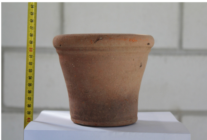
Fig. 16. Mortero (siglo XVI).

MORTEROS. Cucharro de forma de tronco de cono, fondo plano, labio también plano con piqueta vertedora que se utiliza para majar los condimentos y las salsas 112 . Los aparecidos en las bóvedas de San Blas (Fig.16) presentan superficies en basto, sin embargo, los sevillanos llevan la exterior vidriada en verde y la interior en blanco 113 y, en los jerezanos, encontramos algunos con perforación lo que puede hacernos pensar en cacharros de deshecho doméstico o que hubieran sido reutilizados como macetas o semilleros antes de ser incluidos en los rellenos 114 .