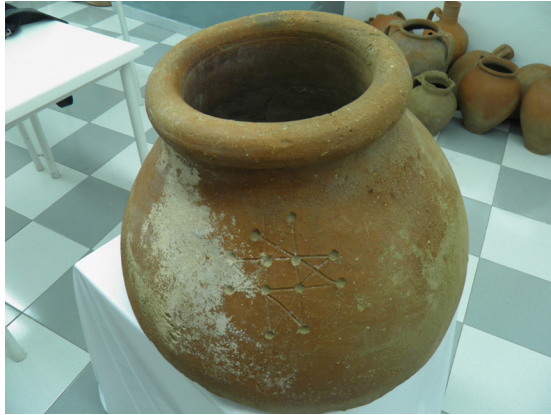
Fig. 14. Tinaja (siglo XVI).

la alfarería de fuego para la elaboración de la comida, como la vajilla de mesa para su consumo.