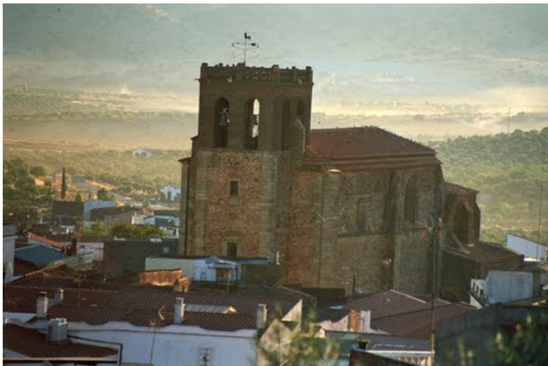
Fig. 4. Vista general de las bóvedas de la iglesia de San Blas. Exterior.

La utilización del relleno cerámico, además de aligerar el peso de las bóvedas y, por consiguiente, aliviar sus empujes verticales y laterales favoreciendo su estabilidad, tenía otras dos funciones que eran también muy importantes. En primer lugar, el relleno se convertía en una cámara aislante que atemperaba las condiciones térmicas interiores tanto en los meses más fríos como en los más cálidos. En segundo lugar, esta misma cámara, servía de caja de resonancia para mejorar la acústica de los edificios absorbiendo la reverberación y amplificando el sonido, como sucedía en algunos teatros romanos con las dolia ubicadas bajo el proscenium .