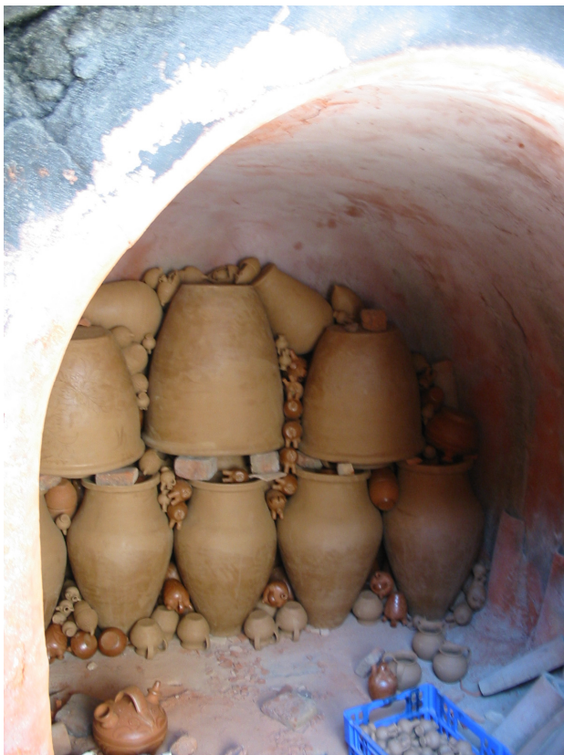
Fig. 1. Horno tradicional de leña.

En esta misma línea argumental, se aduce que la utilización, como acabado decorativo, del vidriado podría ser el reflejo del origen musulmán de la artesanía salvaterreña. El vidriado de Salvatierra, utilizando el plomo como base, es una aportación oriental traída a occidente por los alfareros islámicos y es práctica habitual en la producción