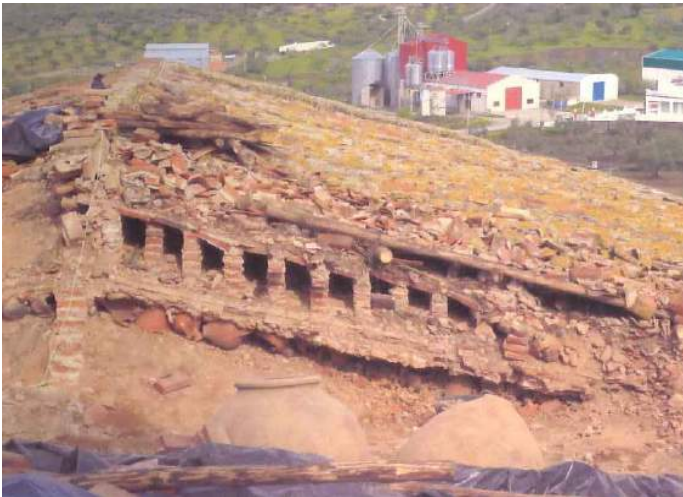
Fig. 9. Tercer plano de apoyo del tejado sobre elementos vegetales.