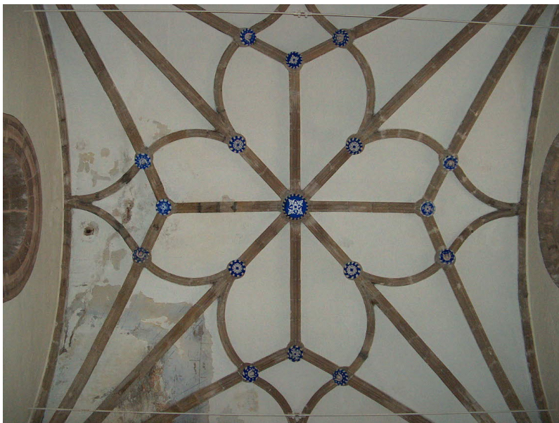
Fig. 3. Patologías de las bóvedas de la iglesia de San Blas. Interior.

XVIII y Madoz 41 a mediados del XIX, que tampoco hacen ninguna mención sobre el asunto pero valora su importancia.