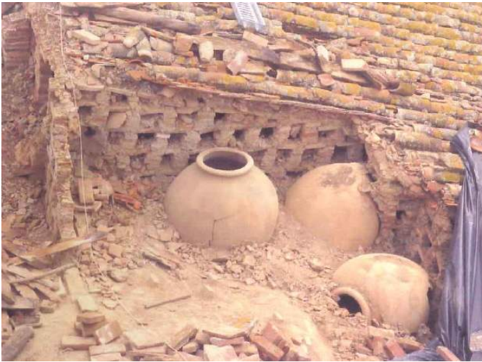
Fig. 8. Tabiques palomeros sobre el relleno cerámico.