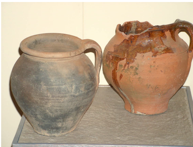
Fig. 18. Pucheros (siglo XVI). (Foto Archivo MAS).

TARROS. Vaso de forma cilíndrica, fondo plano, diferentes anchuras y, generalmente, vidriado interior y exterior. Covarrubias no explica su uso 125 pero sabemos que se utilizaba para guardar productos farmacéuticos, especias y alimentos como la miel, de aquí su denominación local de mieleras. Los tarros, albarelos o botes aparecen en escaso número en las bóvedas sevillanas 126 y jerezanas 127 .