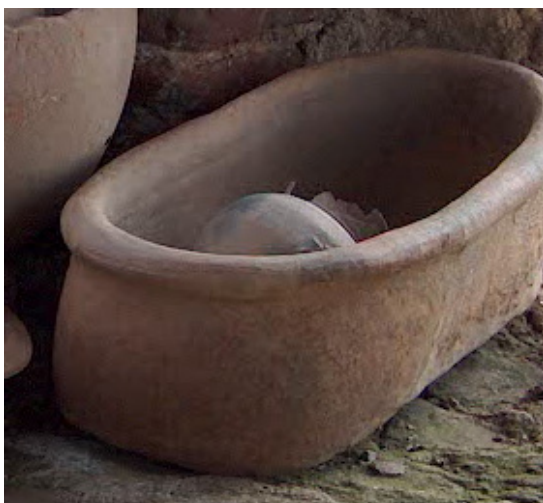
Fig. 20. Bañera/bebedero/comedero (?) (siglo XVI).