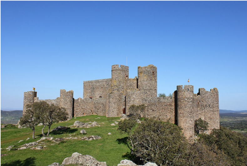
Fig. 2. Castillo de Salvatierra de los Barros.

mrs. 28 . Por desgracia, el exiguo número de judíos vecinos de la villa, unos 30, hacía que tributaran conjuntamente con la aljama de Barcarrota una cantidad de 67.780 mrs., sin especificar el montante de cada uno de los posibles artesanos 29 .