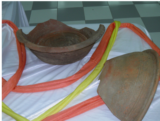
Fig. 15. Lebrillos (fragmentos) (siglo XVI)..