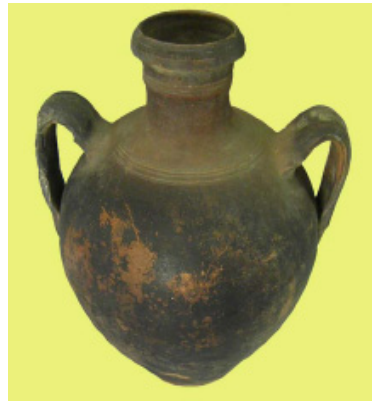
Figs. 10 y 11. Barril (siglo XVI). y Botija (siglo XVI).

BOTIJAS. Vasija globular de pequeño tamaño, de cuello alargado, boca estrecha con moldura, provista de doble asa opuesta de galbo a hombro y base que se va estrechando desde la panza para terminar en solero anular. Suelen llevar decoración incisa de hombro a cuello a base