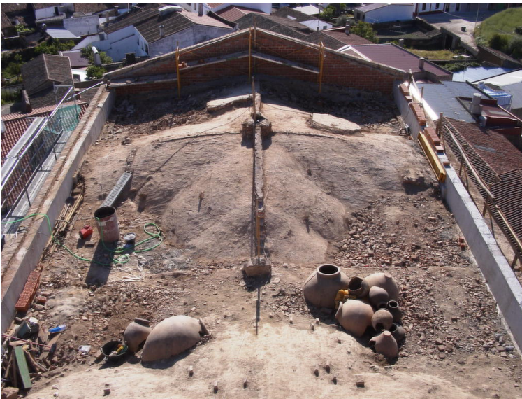
Fig. 7. Tinajas in situ del relleno de los senos de las bóvedas.

dente que los primeros, el que se apoya en el relleno cerámico y el que soporta los tabiques palomeros, podrían ser contemporáneos, aunque no lo creemos y entendemos que se trata de una primera reparación de la techumbre. El tercero, el que se sostiene con maderos, corresponde a reparaciones, en fecha hasta ahora indeterminada, de la cubierta que se producirían como consecuencia de algún fallo en los tabiques palomeros o la rotura de piezas cerámicas de gran tamaño depositadas en los senos de las bóvedas que provocarían humedades de importancia en el interior del templo. En todo caso, es una cuestión que no afectaría a la cronología del depósito cerámico que está sellado por los planos de la techumbre.